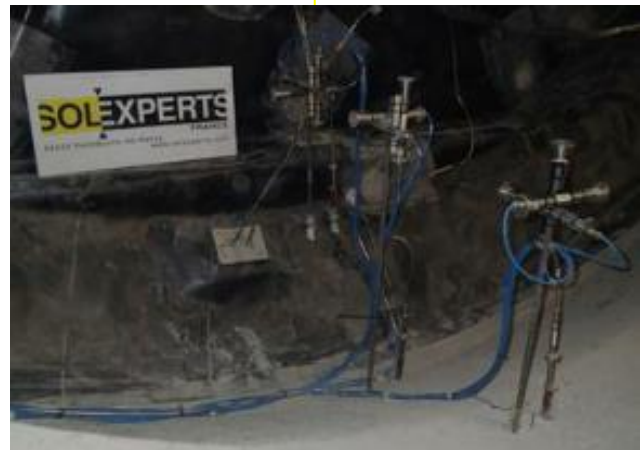
Installation d'extensomètres à corde vibrante (béton)