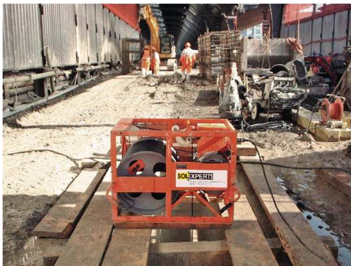
▲ Gare centrale Zürich, gare souterraine

Solexperts répond exactement aux demandes des ingénieurs, des entrepreneurs et des maîtres d'ouvrage avec son appareil de mesure à ultrason. Cet appareil permet de mesurer le profil et la verticalité d'excavations et de les comparer avec les valeurs théoriques. Lorsque les excavations sont terminées, l'appareil est positionné et centré à l'intérieur du pieu ou de l'élément de paroi moulée. Le capteur à ultrason est alors descendu tout le long de l'excavation pour effectuer la mesure. Pendant la descente, la distance entre le capteur et les deux parois opposées est mesurée en continu et imprimée directement sur papier. L'orientation du capteur est tournée électroniquement à 90°, ce qui permet d'obtenir la mesure de la section normale. La mesure à ultrason permet d'utiliser aussitôt les premières observations pendant que la mesure est encore en cours.