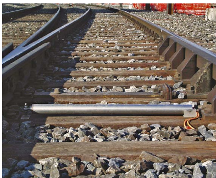
Neigungssensor auf Bahnschwelle montiert

Die beiden Gleise oberhalb der Nagelwand werden während den Bauarbeiten automatisch und kontinuierlich bezüglich Querneigungsänderung überwacht. Ab einer Querneigungsänderung von 3.5‰ müssen zur Sicherstellung des Bahnbetriebes bauliche oder betriebliche Massnahmen ergriffen werden.